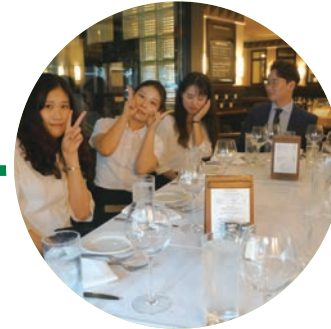
Day7 | • 자유일정