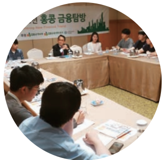
Day1 | • 금융탐방: 홍콩화폐관리국(HKMA) • 현지 금융전문가와의 대화