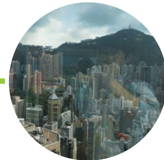
Day3 | • 자유일정 • 금융실무자와의 대화