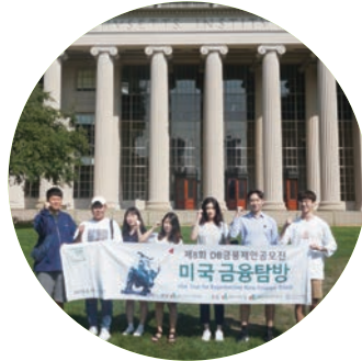
Day6 | • IVY탐방: MIT, Harvard Univ. • 금융전문가와의 대화