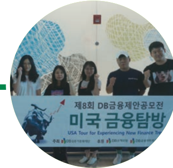
Day8 | • 귀국