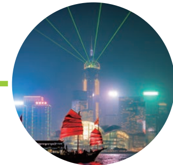
Day4 | • 귀국