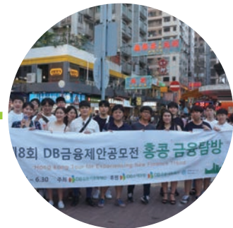
Day2 | • 금융탐방: ANZ Bank, Invesco • 홍콩 문화 탐방: 소호 거리, 빅토리아 피크, 미드레벨 엘리베이터 등