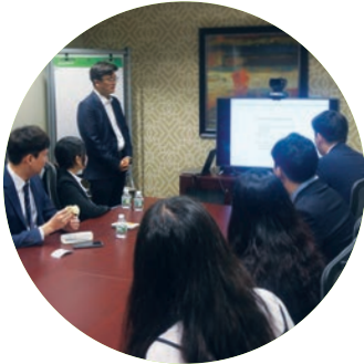
Day5 | • 금융탐방: DB손해보험 뉴욕 투자사무소 • IVY탐방: Yale Univ